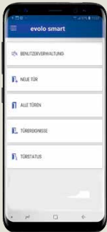
Smartphone zur Programmierung